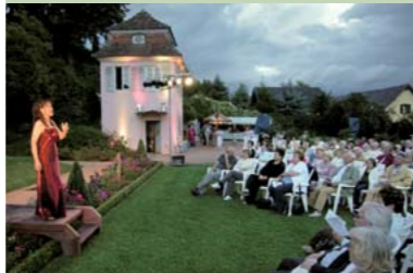
Flanieren im Prinzengarten mit Tanzaufführungen der Biedermeier- gruppe aus Offenburg